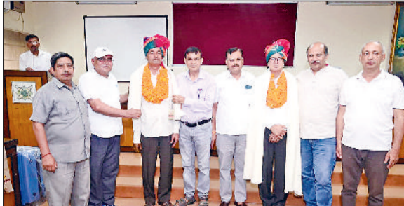
सोनीपत। सेवानिवृत्त होने वाले कर्मचारी साथियों को सम्मानित करते हुए।