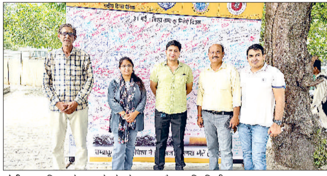
सोनीपत। अभियान के तहत रेलवे स्टेशन पर मौजूद हरिभूमि टीम।