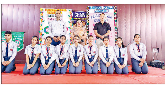
खरखोदा। भाषण प्रतियोगिता के प्रतिभागी विद्यार्थी।