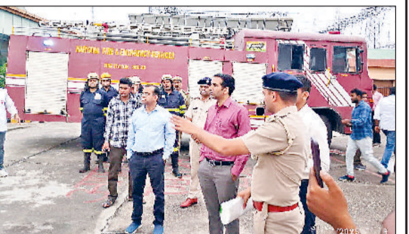
सोनीपत। मॉक ड्रिल के दौरान निरीक्षण करते हुए उपायुक्त एवं अन्य अधिकारीगण।