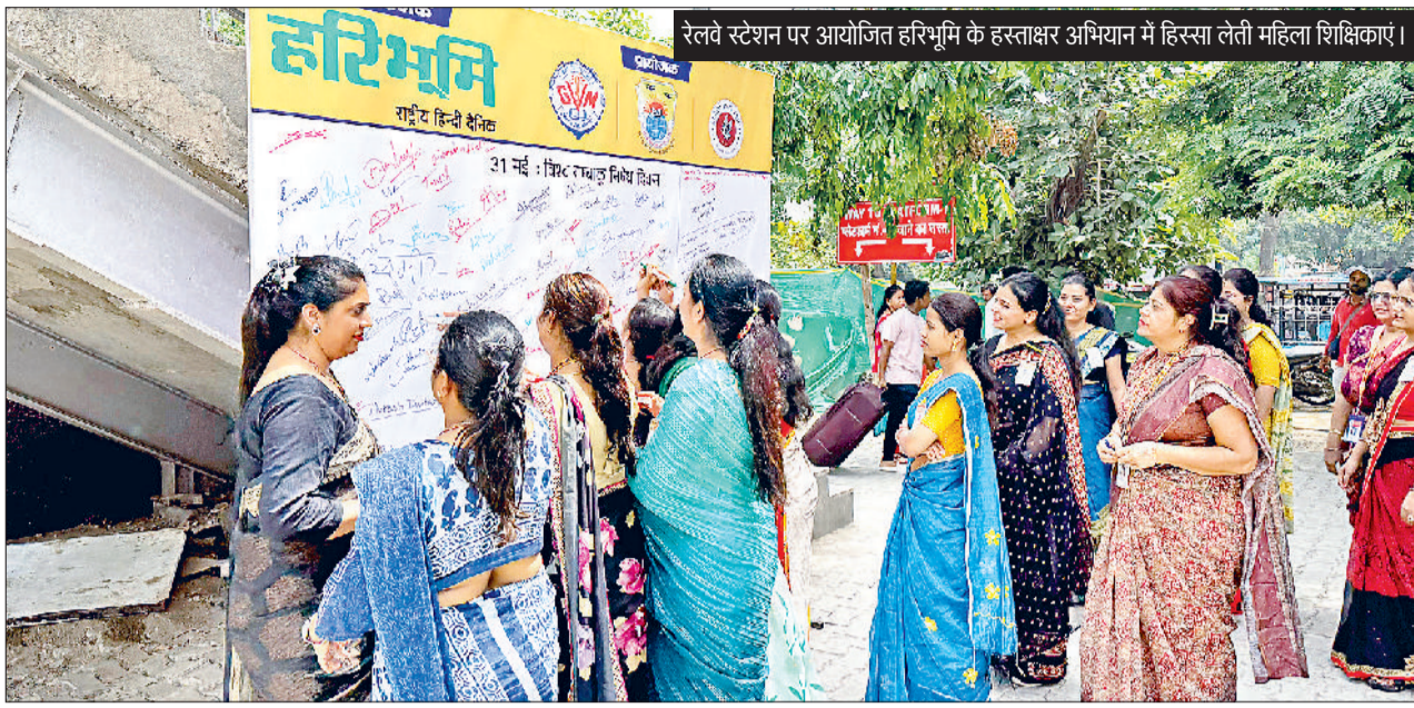
रेलवे स्टेशन पर आयोजित हरिभूमि के हस्ताक्षर अभियान में हिस्सा लेती महिला शिक्षिकाएं।