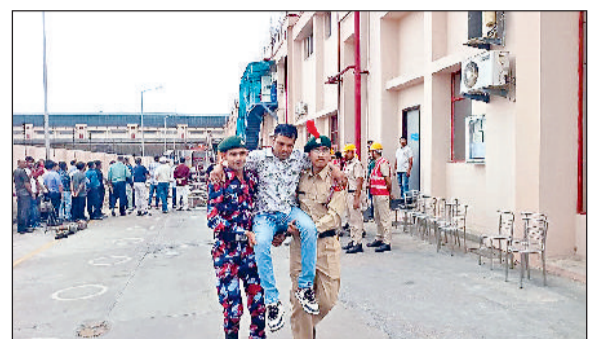
सोनीपत। मॉक ड्रिल के दौरान घायलों को ले जाने का अभ्यास करते हुए कैडेट्स।

जिला प्रशासन द्वारा गृह मंत्रालय, भारत सरकार के दिशा-निर्देशों के तहत शनिवार को 'ऑपरेशन शील्ड' के अंतर्गत जिला के तीन स्थानों पर व्यापक नागरिक सुरक्षा अभ्यास (मॉक ड्रिल) का आयोजन किया गया। यह अभ्यास गांव जाजी स्थित बिजली निगम के 220 केवी सब-स्टेशन, गांव नाहरा स्थित एचपीसीएल के सीटी गेट कम मदर स्टेशन, और गांव रेवली स्थित ब्रेक पाटर्स इंडिया कंपनी में किया गया। सायं 5:00 बजे सायनर बजने के साथ तीनों स्थानों पर अभ्यास आरंभ हुआ। सभी चिह्नित संस्थानों में मौजूद लोग तुरंत प्रभाव से बाहर आकर सुरक्षित स्थानों पर पहुंच गए। ऊपरी मंजिलों पर फंसे लोगों को फायर ब्रिगेड कर्मियों, रेडक्रॉस के आपदा मित्रों तथा 12 हरियाणा बटालियन एनसीसी के कैडेट्स द्वारा सुरक्षित रूप से नीचे लाकर उपचार हेतु निम्नवर्ती अस्पतालों में भेजा गया। आगजनी की स्थिति का भी सफलतापूर्वक मुकाबला किया गया। गांव जाजी स्थित बिजली घर और नाहरा स्थित एचपीसीएल में मॉक आगजनी की स्थिति उत्पन्न की गई, जिसमें रेस्क्यू टीमों ने तत्परता से कार्रवाई